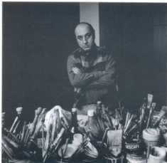
Уметникот во ателијо.