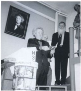
Od otvoranjeto na edenozemната izložba "Portret na Plejnzhi" vo inžinjerica „Tajbernogol“, Skopje, 2003

Vo Rim i Pariz e izložбата Dejloszi: Makedonska umetništvo denes. So soprugata ostarjuvaat putuvanja vo poveќе skandinavski zemqi: Švedzka, Fenska, Danzka, Norveziška, Holandija posetuvaјќи mnogu muzeji, osobeno muzeji od nacionalen karakter.