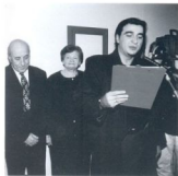
Отворање на самостојната изложба „Македонски иконостаѕ“, МГС, Скопје, 2001 (Сенко Великов)

Самостојната изложба - Македонски иконостаѕ, беше отворена на 27 ноември и предизвика дотогаш незапазтен интерес и посетеност. Изложбата предизвика големи полемички и контроверзни во јавноста, со неосновани политички квалификации. За него неговата порака е искрена и света по својата квеста и ѝ изненаден од некои реакции што се појавија во јавноста.