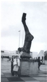
Во Берлин пред скулптура на Марко Марони